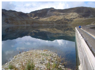
Centrales hydroélectriques sur les affluents du Rhône (part communale)